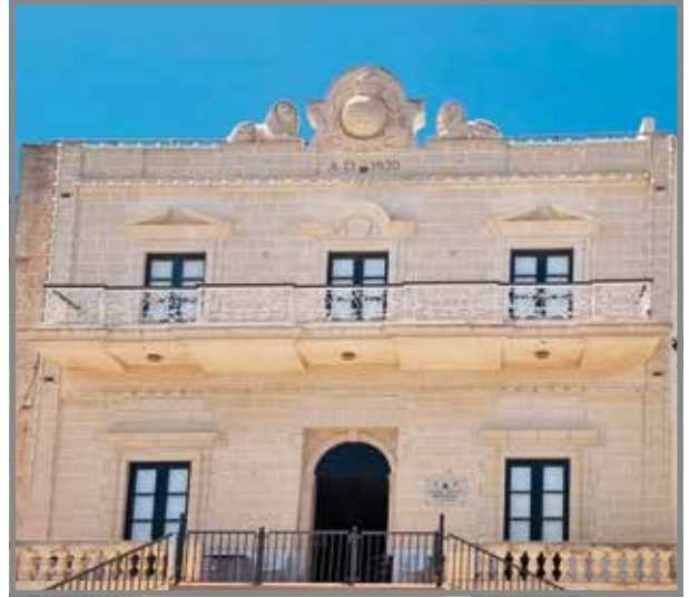
Ritratt tal-faċċata l-antika tal-Kazin Imperial (xellug) u ieħor tal-faċċata l-ġdida tal-kazin (lemin).